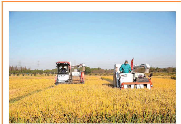
万亩良田“丰”景美，大米加工厂加工忙。

会后，与会人员实地参观了小昆山大米加工厂，充分感受到近年来小昆山镇党委推进乡村振兴的有力举措和实实在在的成效。(综合党委)